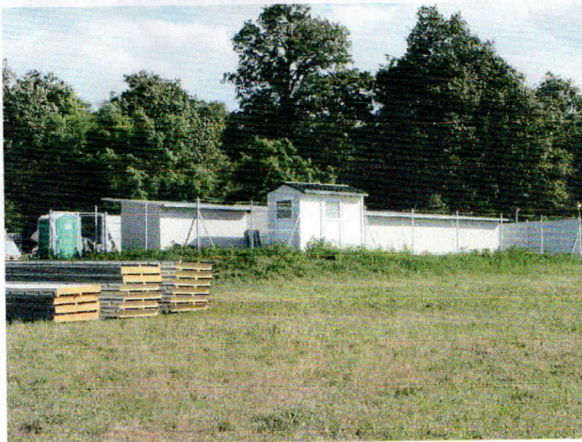
Az elkészült elkülönítő 2022-ben