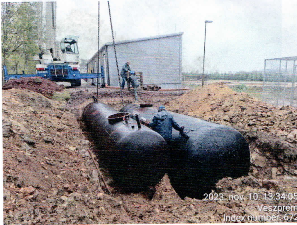
A 10 + 25 m 3 -es tűzivíz - tartályok telepítése, 2023. november

8200 Veszprém, Ady E. u. 9. allatotthon.veszprem@gmail.com Adószám: 18913316-1-19; bankszámla: 11748007-20088040, T: +36 20 266 88 85; vagy: +36 30 6202878 www.veszpremiallatvedok.hu/alapitvany