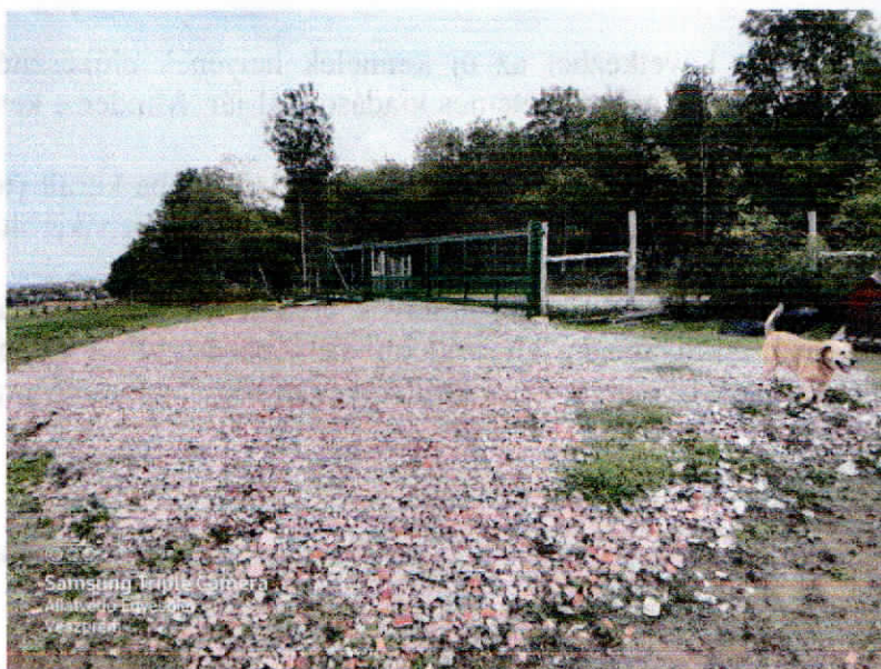
A területünk 2020-ban